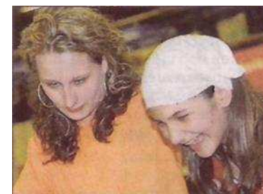
Gute Laune - das Markenzeichen der WM in der Hohenstaufenstadt.