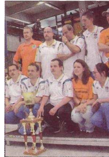
Die Niederlande belegten bei der WM den dritten Platz.