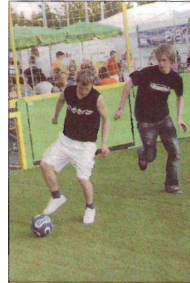
Jede Menge Spaß war auch beim Inter-sport Speed Soccer Cup angesagt.