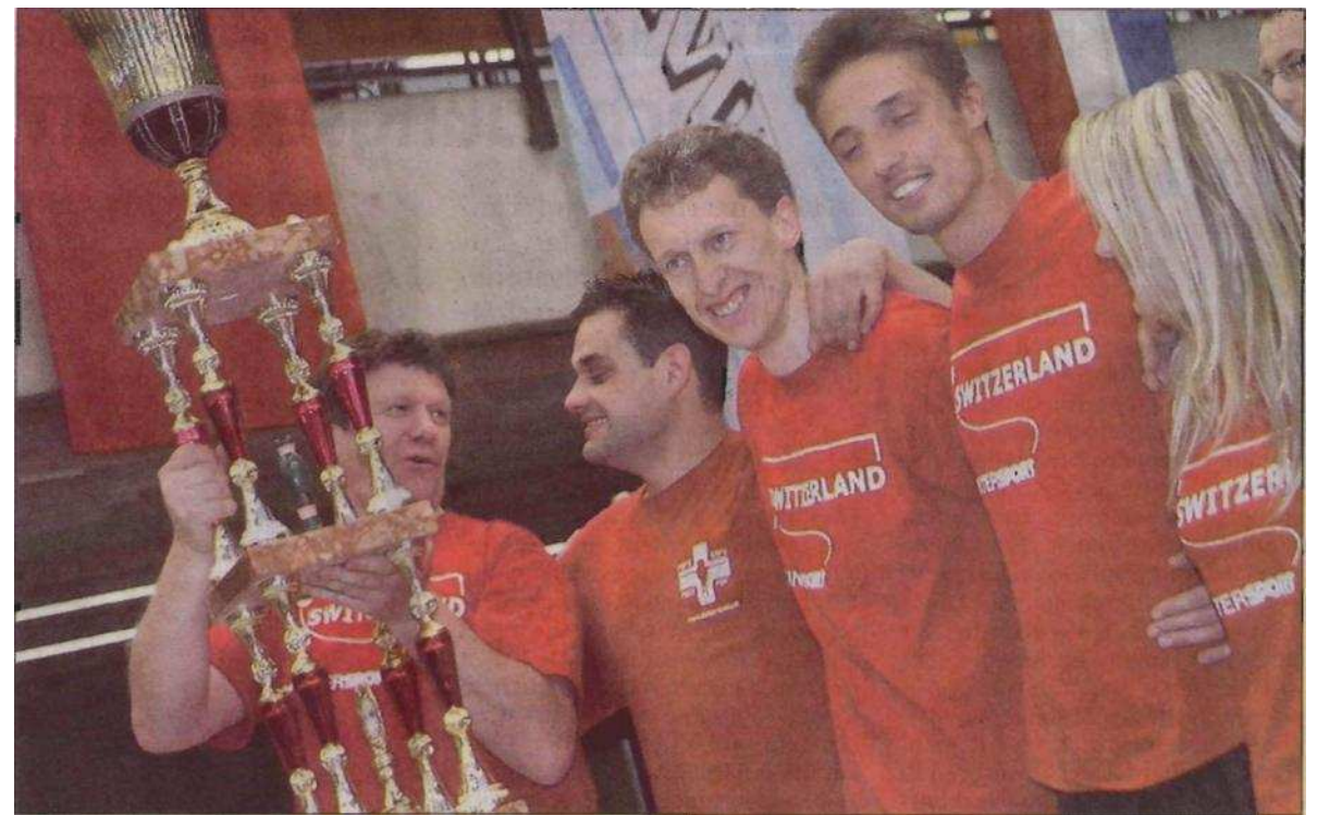
Zufriedene Gesichter trotz der Niederlage im Finale gegen Deutschland gab es beim Team aus der Schweiz. Die Stimmung in der Halle machte deutlich: Am Ende waren alle Sieger.