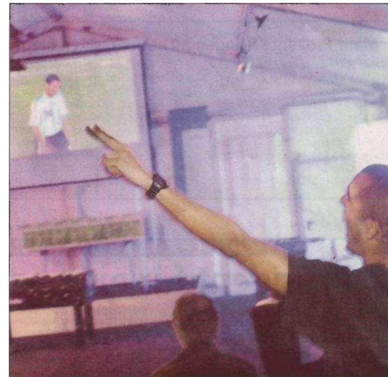
Am Samstagabend ging's im Zelt um den etwas größeren WM-Ball: Hier jubelt ein Fan über den Sieg Argentiniens gegen die Elfenbeinküste.