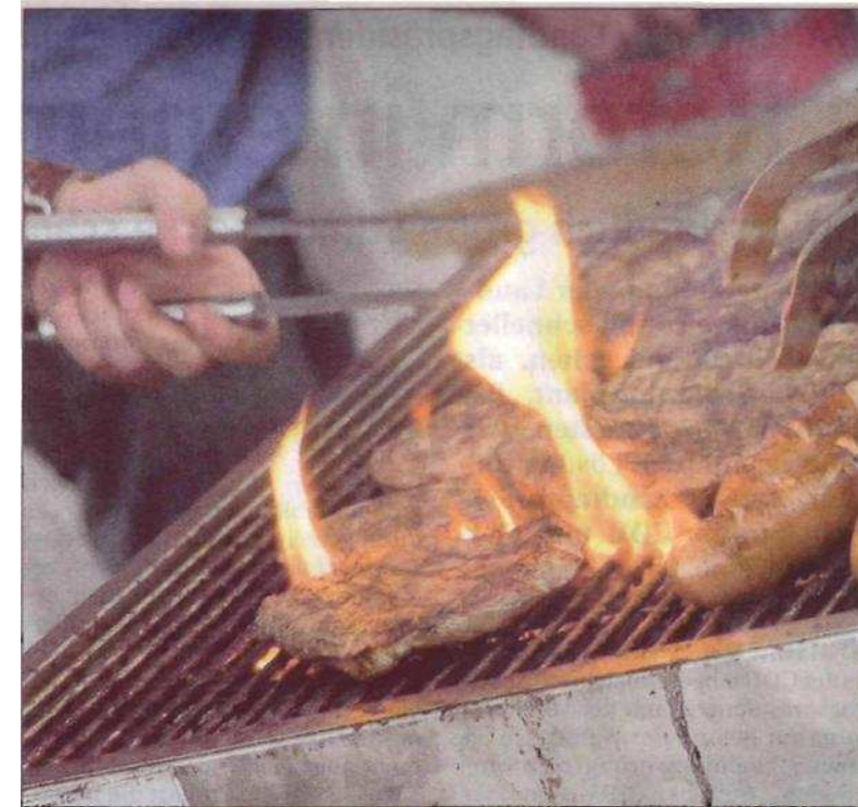
Stärkung für Tischkicker und Gäste: Rund um die Hohenstaufenhalle duftete es verführerisch nach Steaks und Roter Wurst.