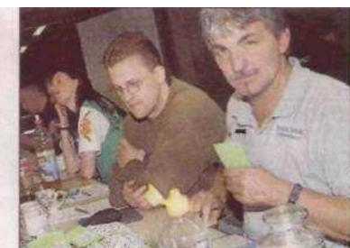
Hier wurde genau eingetragen, wer wann an welchem Tisch spielt.