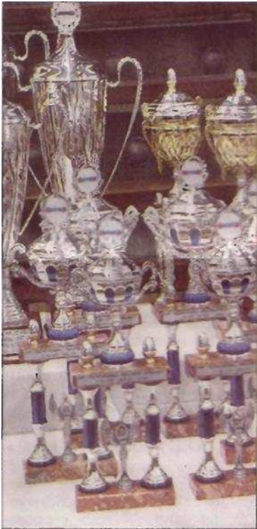
Glitzernde Objekte der Begierde: die Pokale der Tischfußball-WM.