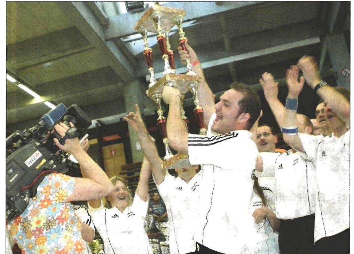
Was die deutsche Fußball-Nationalmannschaft noch erreichen will, haben die deutschen Tischkicker bei der WM in Göppingen schon geschafft: Sie sicherten sich gestern den Titel. Der Jubel in der Hohenstaufenhalle war groß.

Rund um die Arena herrschte in den vergangenen Tagen Festivalstimmung. Teilnehmer des internationalen Tischkicker-Turniers übernachteten hinter der Halle in Zelten, Wohnmobilen und Wohnwagen. Die Sommernachtsparty am Samstagabend in der Lounge neben der Halle kam zwar erst nach Mitternacht so richtig in Schwung, doch dafür bewiesen die Besucher einen langen Atem. Dort, wo sich nach Frisch-Auf-Heimspielen die Sponsoren des Handball-Bundesligisten ein frisch gezapftes Pils gönnen, wurde getanzt und getanzt. Spontane Breakdance-Einlagen wurden von der Menge beklatscht - und wer immer noch nicht genug hatte vom Tischkicken, konnte auch im Zelt seinem Hobby weiter fröhnen. Draußen sorgten Spielangebote für Abwechslung, es duftete nach Paella