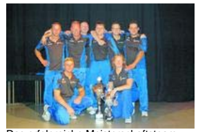
Das erfolgreiche Meisterschaftsteam des Tischfußballvereins Wild-Card Wiesbaden.

Während sich viele Augen jedes Wochenende auf die großen Fußballplätze der Zweiten Fußball-Bundesliga richten, sind andere Wiesbadener mit dem gleichen Spiel im Kleinformaat viel erfolgreicher, als der "große Bruder" SV Wehen-Wiesbaden. Der Verein Wild-Card Wiesbaden wurde nämlich 2008 erstmalig Deutscher Mannschaftsmeister der Ersten Tischfußball-Bundesliga.